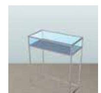
Art. 30 / 31