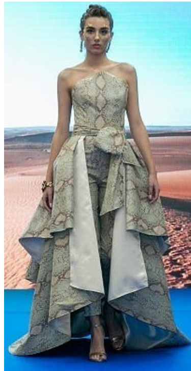
2019 – Savage